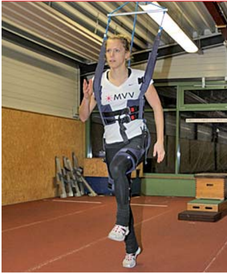
Verena Sailer mit dem neu konstruierten Trainingsgerät der MVV Energie.

Innovatives Trainingsgerät trägt Top-Athleten zu Spitzenleistungen