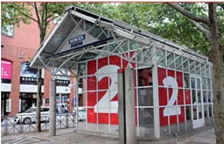
Das Kapuzinerhäuschen der Stadtmarketing Mannheim GmbH bietet Raum für Ideen.