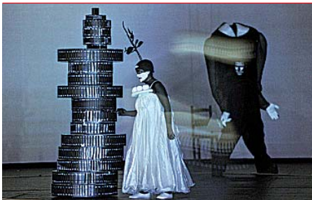
Bilfinger Berger unterstützt die Dokumentation des Neuen Mannheimer Rings.