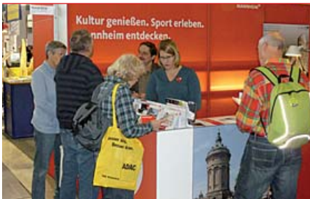
Der Messestand des Stadtmarketings auf der CMT in Stuttgart