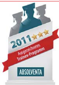
Nach den Kriterien des Siegels sind Trainee-programme Bestandteil des Talent- und Nachfolgemanagements und auf eine langfristige Zusammenarbeit in einer Experten- oder Managementfunktion ausgerichtet.

Roche in Deutschland mit Trainee-Siegel ausgezeichnet