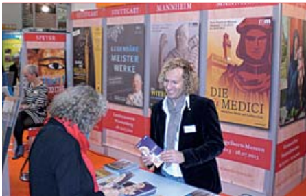
Die Reiss-Engelhorn-Museen präsentieren ihr breites Angebot aktueller und kommender Ausstellungen auf Reismessen.

Reiss-Engelhorn-Museen auf Reismessen vertreten