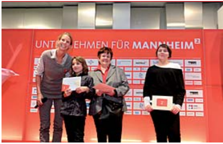
Hockey-Olympiasiegerin Fanny Rinne überreichte den glücklichen Gewinnern ihre Preise.