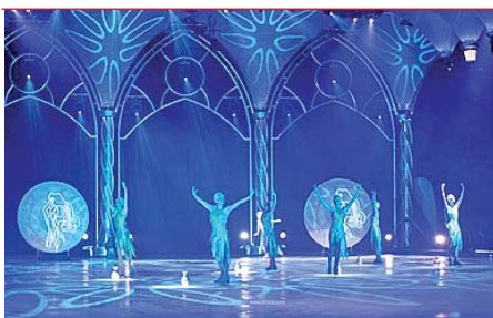
Holiday on Ice in der SAP Arena