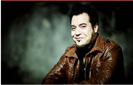
Laith Al-Deen gastiert am 3. Februar im Capitol.